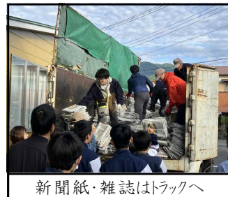
新聞紙・雑誌はトラックへ