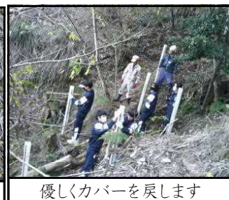
優しくカバーを戻します

お知らせ HPIに掲載中です。・グランドデザイン・学校だより・柚野中部活動ガイドライン・危機対応マニュアル・学校いじめ防止基本方針・自転車安全利用5則・出席停止について(解除の様式等)