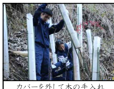
カバーを外して木の手入れ

12月6日(金)3年生が、地域保全活動をしているNPOの皆様とともに柚野山整備を行いました。小学校の時に植樹をした柚野山の手入れの一つとして、今回は、一旦保護カバーを外して、中の木を手入れする育樹活動を行いました。短い時間でしたが、作業に没頭していました。