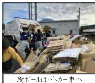
段ボールはパッカー車へ

11月17日(日)、今年2回目の古紙回収が行われました。早朝よりご協力ありがとうございました。合計18370kgの古紙を回収することができました。小学校と折半し9185kg分で64295円の収益となりました。後日富士宮市から奨励金27555円を加え、中学校の教育振興のために、活用させていただきます。