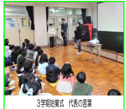
3学期始業式 代表の言葉