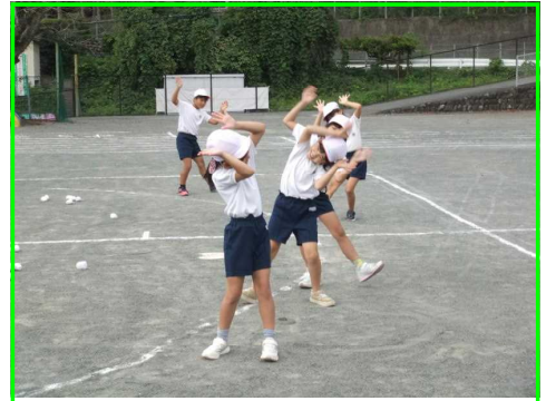
1,2年 ダンシング玉入れ

いよいよ、今週の土曜日は運動会です。体育の授業や休み時間の練習にも、ますます力が入ってきています。9月の生活目標は「友達と声をかけ合って挑戦しよう」でした。これは、運動会を意識した目標です。「友達と声をかけ合って」は、仲間と力を合わせたり、助け合ったりすることですね。「挑戦しよう」は、自分の目標をもって練習することですね。運動会に向けて、どの学年も仲間と協力しながら、一つ一つしっかりと練習を積み重ねてきています。1、2年生は、「チェッチェッコリ」や「ジャンボリーミッ