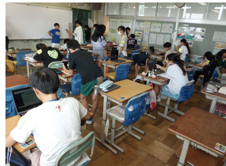
6年生の授業の様子

本年度、学校教育目標を「自ら学び続ける子」に変更し、半年が過ぎました。1学期の取組により、児童の学校評価では、「学習のめあてに向かって、みんなで学び合って学習を進めている。」が100%、「自分で進んで取り組める活動が、学校生活にある。」が98%と、こどもの主体性に関する項目が高評価でした。これからの変化の激しい予測困難な社会で答えのない問題に最善策を見つけて生きていくために、将来にわたって自分で学び続けることが必要とされます。そのために、小学校では、こども一人一人が学び方を学ぶことが求められています。