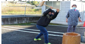
力強いもちつきの姿

つきたてのおもちで作った大福はとてもおいしくできあがり、子供たちは大喜びでした。