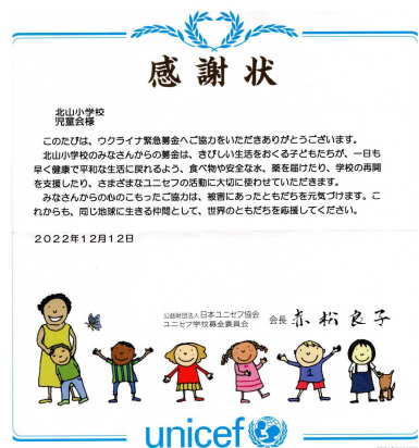
ユニセフから届いた感謝状