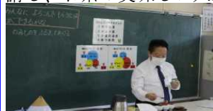
講師による茶のいれ方の説明 実際にお茶をいれてみました

北山小は静岡県教育委員会より「ひろがる茶育推進モデル校」の指定を受け、お茶と教科の学習を結びつけた「静岡茶食育カリキュラム」の研究に取り組んでいます。5年生と3・4・5組の児童が、家庭科や自立活動の授業として茶育講座を講義し、お茶の美味しい入れ方を学びました。