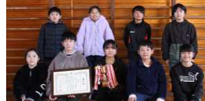
スポーツ委員の5・6年生