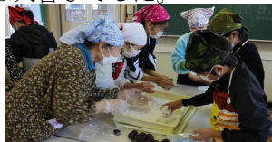
つきたてのおもちで大福作り