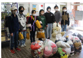
美化リサイクル委員とぬいぐるみ・衣類