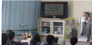
ケータイ・スマホ講座

6年生はあと3か月で小学校を卒業します。中学生になると様々な人と出会い、行動範囲も広がるようになります。正しい情報を収集し、正しく判断する力が求められます。その基礎として、ケータイ・スマホ講座、薬学講座を実施しました。6年生は講師の話に真剣に耳を傾けていました。