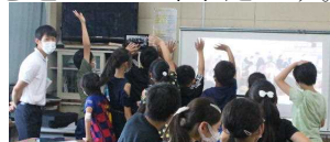
最後は手を振ってお別れ