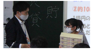
1億円の札束は重さ10kg