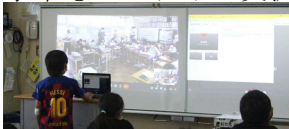
山宮小の児童に向けて説明

1学期に、5年生が山宮小5年生とオンライン交流授業を行いました。国語で学習した「まちじまんを推薦しよう」にならって、北山小学区の自慢、山宮小学区の自慢をそれぞれが調べ、推薦しあいました。発表を聞いた後には、発表の仕方の良かったところを称揚したり、アドバイスしたりすることができました。2学期には他学年もオンライン交流を進めていく予定です。