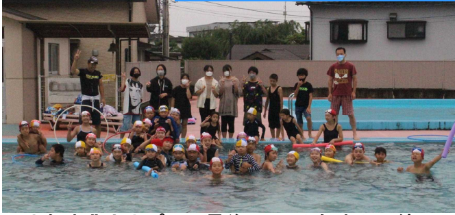
6年生北山小プール最後の日 1年生と一緒に

7月1日のプール開きから7月22日の終業式の日まで、体育の授業では可能な限り水泳の授業を行いました。指導する教科担任の他に、さらにもう一人の教員を配置し、安全かつ個に応じた指導ができるようにしました。